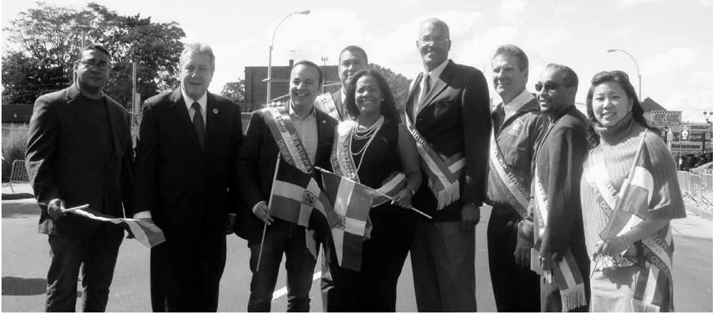
그레이스 멩 주하원의원이 제4회 연례 퀸즈 도미니칸 퍼레이드에 참가