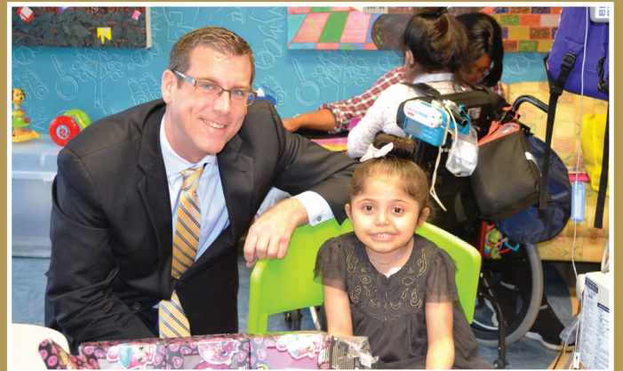
제 8회 연례 크리스마스 선물 후원회를 통해 모인 인형을 Braunstein 하원의원이 세인트 메리 아동병원 (St. Mary's Hospital for Children) 의 환자들에게 전달했습니다.