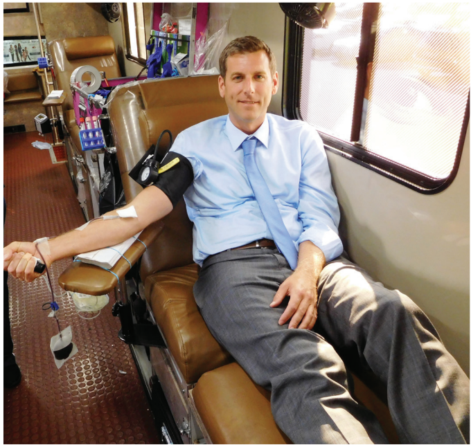
Braunstein 하원의원이 뉴욕 혈액 센터와 공동으로 주관한 제 7회 연례 여름 헌혈 행사에는 138명의 혈액 기부자들이 참여하여 최다 참여 기록을 갱신하였습니다.