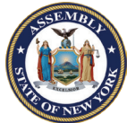
州眾議員 威廉 寇頓