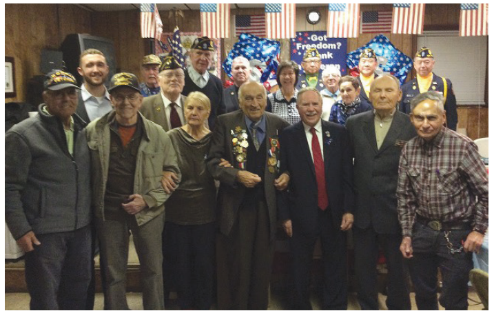
Депутат Ассамблеи Колтон на ежегодном мероприятии в честь Дня ветеранов, на котором он чествовал наших героев и вручил им сертификаты и нагрудные значки с флагом США.