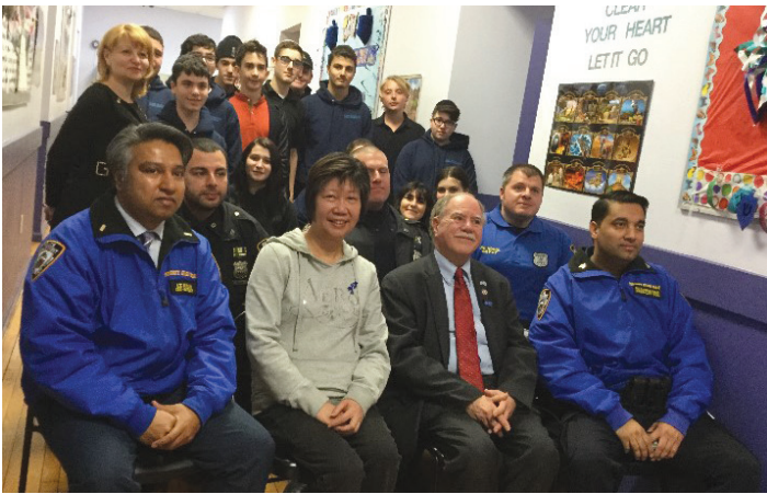
Депутат Ассамблеи Колтон и полицейские на встрече со старшеклассниками «Элит Академи», где полицейские рассказывали детям о том, как опасно принимать наркотики.