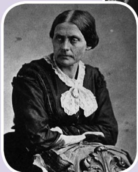
Susan B. Anthony