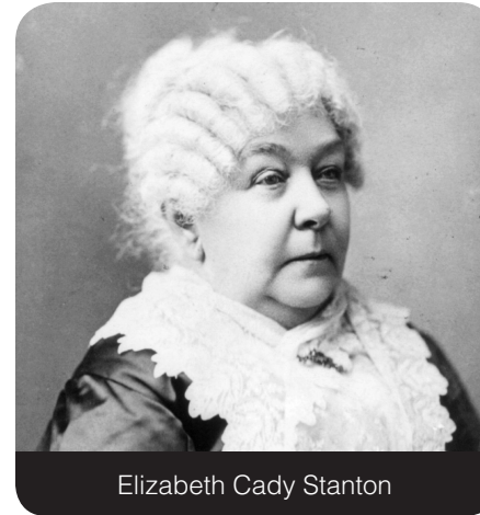
Elizabeth Cady Stanton

第二天，7月20日，廢奴主義者 Frederick Douglass 做了一個強有力的演講，把廢除奴隸制度和提倡婦女權利這兩股力量團結在一起。這一天，大會還投票表決通過了《感傷宣言》。68位婦女和32位男仕在該宣言上簽字，使之成為合法文件，由此，婦女權利運動正式拉開序幕。