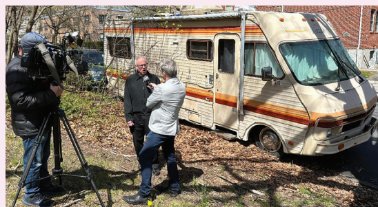
The cars and trucks that have been removed throughout the district.