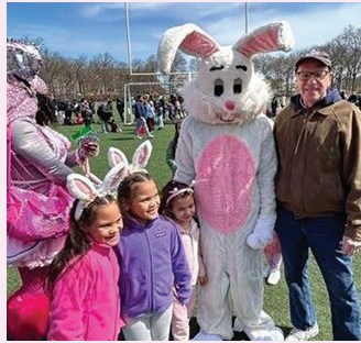
Assemblyman Dinowitz with residents of Norwood and the Easter Bunny.

El asambleísta Dinowitz con residentes de Norwood y el Conejo de Pascua.