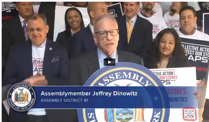
Assemblyman Dinowitz speaks outside of the New York State Capitol Building.

By addressing the scourge of shoplifting head-on through these legislative proposals, we aim to safeguard the vitality of businesses and create a more secure environment for workers, patrons, and entire neighborhoods alike.