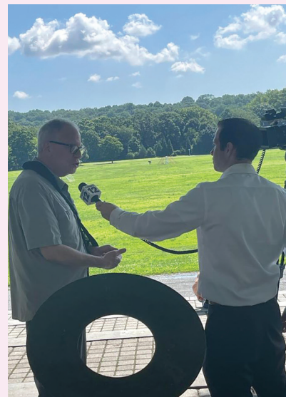
Assemblyman Dinowitz speaking outside of Van Cortlandt Park where the Cricket Stadium is proposed.

No considero que este plan propuesto funcione. Como un defensor por mucho tiempo de Van Cortlandt Park, creo que la ciudad no debe seguir adelante con este proyecto tan grande.