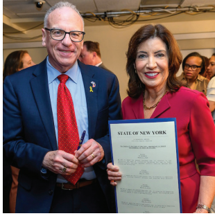
Assemblyman Jeffrey Dinowitz and Governor Kathy Hochul.

Agradezco a la auspiciadora en el Senado Estatal, Liz Krueger, y a la gobernadora Hochul por su apoyo.