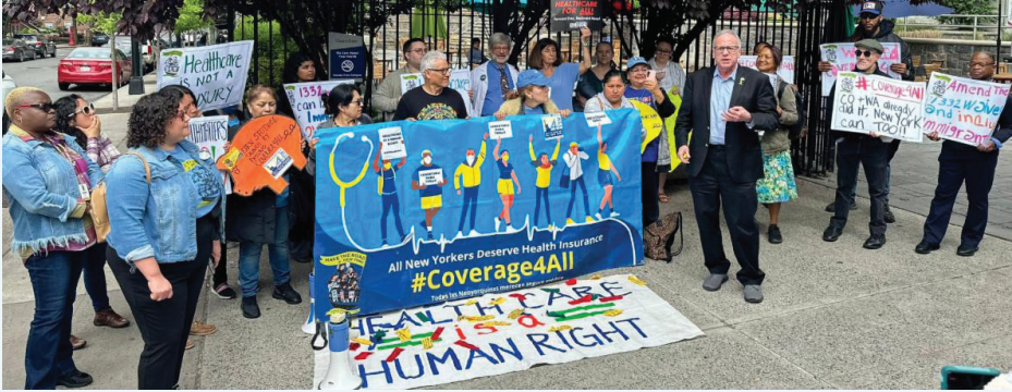
Assemblyman Jeffrey Dinowitz with healthcare workers and members of 1199SEIU.

Asistí a una manifestación del Sindicato 1199SEIU en Norwood en el Hospital Montefiore. Fue emocionante e inspirador presenciar la apasionada abogacía por los trabajadores del cuidado de la salud y el cuidado a los pacientes.