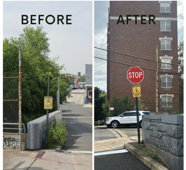
Before and After of the Stop Sign being replaced. El antes y el después de reemplazarse la señal de pare.

Nuestra oficina exitosamente facilitó el reemplazo de una crucial señal de pare que se había removido en una intersección muy transitada en la Calle 238 Oeste y la avenida Putnam, al lado de BJ's . Esta intersección ha tenido tránsito peatonal y vehicular significativo, y la señal de pare que faltaba representaba un riesgo de seguridad grave para la comunidad. Al trabajar rápidamente con oficiales de la ciudad, aseguramos la instalación de una nueva señal de pare, reforzando nuestro compromiso a mantener nuestras calles seguras, tanto para los conductores como para los peatones.