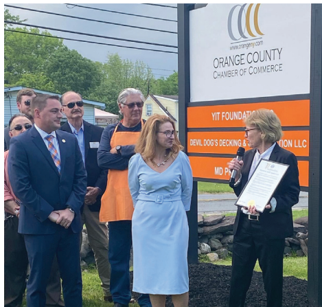
Feliz de trabajar con la Cámara de Comercio del condado de Orange para ayudar a traer más desarrollo económico a nuestra área