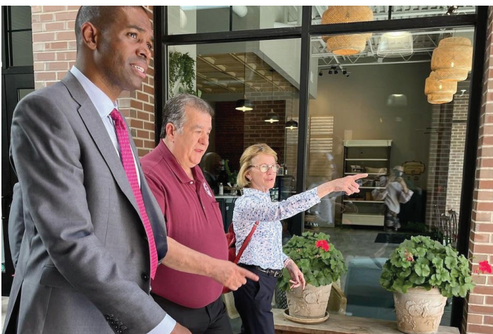
Visitando proyectos de desarrollo económico en Middletown con el vicegobernador Antonio Delgado y el alcalde Joe DeStefano