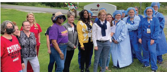
Luchando con nuestros enfermeros para salvar las únicas camas en la Unidad de Cuidados Coronarios (CCU, por sus siglas en inglés) en el condado de Sullivan